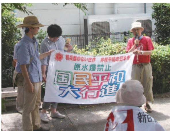
清瀬市から東久留米市へ旗のリレー