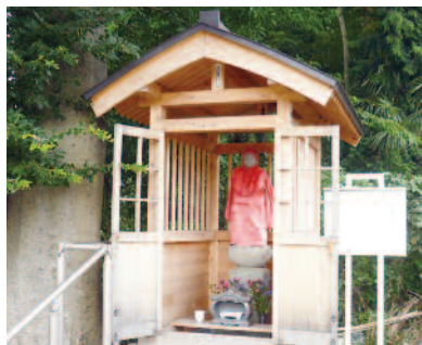
大切に使われている祠