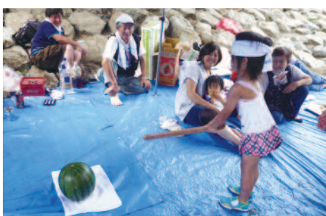
大人たちの熱い声におされて「えいっ!!」