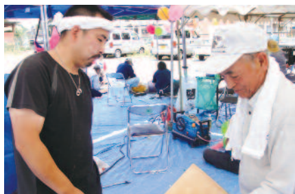
卒業生が住宅デーで活躍

東京建築カレッジでは、来年度の新入生募集を始めました。清瀬久留米支部からもカレッジ生となり卒業して地元で頑張っている仲間がいます。卒業制作では、グループで祠を製作し寄贈しました。「自分から積極的に取り組み