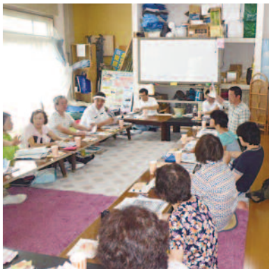
扇風機で涼を取りながら

テント側の川は浅瀬ですが、対岸は深く小学生が浮き輪を使って泳げる深さです。子どもたちが水着に着替え、親子で水をかけあったり、魚を探したり学校の