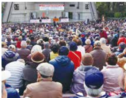
2月13日（金）、寒風が吹き抜ける中、日比谷野音に3300人の仲間が集