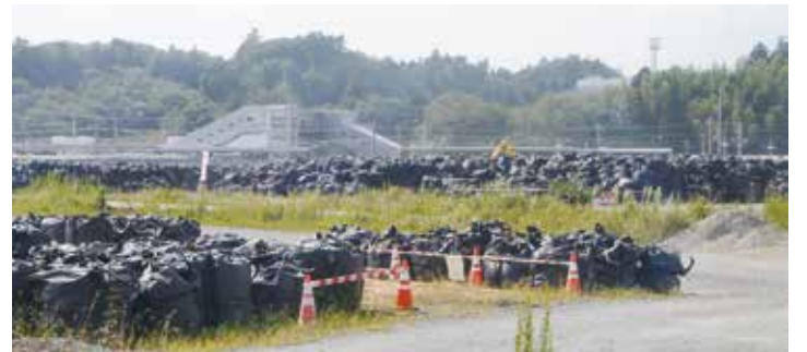
富岡駅舎は新設され10月に向けて試験運転中だが、その隣には除染の際に出た大量のフレコンバッグが積み上げられたまま

いまし、住宅デーは、復興住宅と地元の住民との交流を進めることのできる取り組みとして、大きな力になっていくことが分かる取り組みでした。