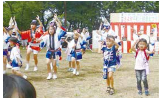
上：滝山中央舞まい連の阿波踊りにちびっ子の飛び入り参加 下：親子木工教室は金槌の音と笑顔が飛び交う