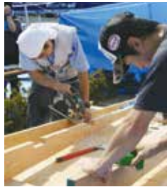
スロープ製作する仲間

いまし、住宅デーは、復興住宅と地元の住民との交流を進めることのできる取り組みとして、大きな力になっていくことが分かる取り組みでした。