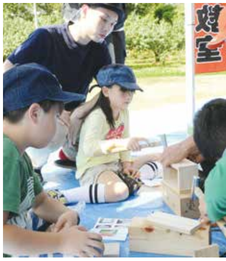
住宅デーの木工教室は福島でも一番人気

きた仮設住宅が今年4月で撤去され、北沢 150人の来場者でにぎわいました。住宅デーは、復興住宅と地元の住民との交流を進めることのできる取り組みとして、大きな力になっていくことが分かる取り組みでした。