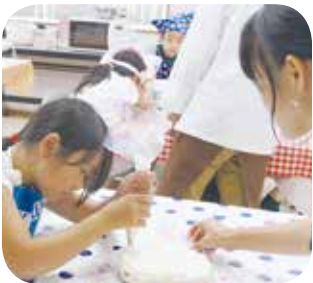
先生の指導のもと、一つ一つ丁寧に作業する子ども達の真剣な表情が印象的でした